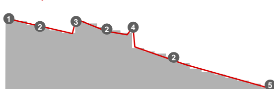
Piano di prelievo

Il piano di prelievo Swisscanto Flex Invest consente di ritirare somme note in anticipo, d'importo sempre uguale e quindi programmabili. Anche in questo caso periodicità e importi sono improntati alla massima flessibilità. È possibile impostare eventuali mutamenti a livello di strategia d'investimento redistribuendo il capitale sui vari fondi. L'opportunità di effettuare versamenti straordinari o prelievi parziali e di operare interruzioni temporanee dei pagamenti completano la forza di attrazione del prodotto.